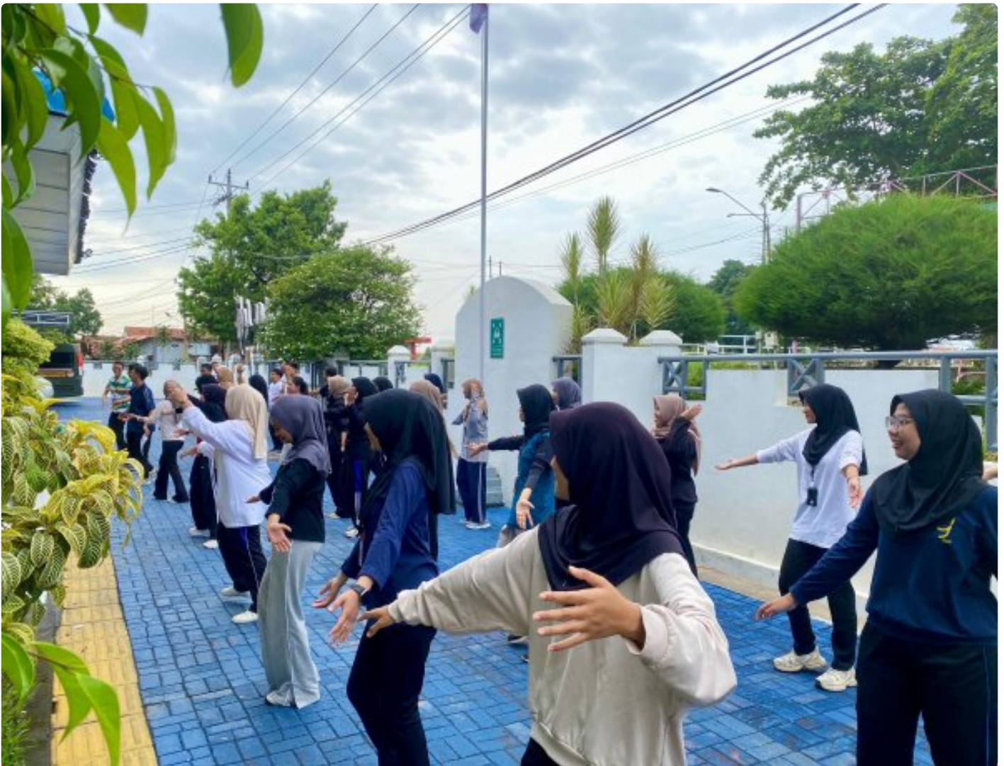
Jaga Kebugaran, Peserta Maganghub Rutan Pekalongan Senam Bersama

Pekalongan - Dalam rangka menjaga kebugaran fisik, seluruh peserta Maganghub Rumah Tahanan Negara Kelas IIA Pekalongan mengikuti kegiatan senam pagi bersama yang dilaksanakan di halaman Rutan, Sabtu (13/12/25).