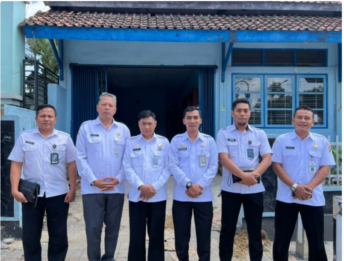
Kakanwil Ditjenpas Jateng Tinjau Area Terdampak Banjir di Lapas Pekalongan, Kegiatan Kemandirian Tetap Berjalan