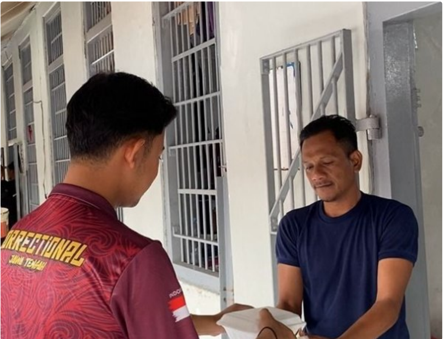
Lapas Pekalongan Gelar Bakti Sosial, Berbagi Bubur Ayam untuk Warga Binaan dan Pegawai

PEKALONGAN – Lembaga Pemasyarakatan (Lapas) Kelas IIA Pekalongan menggelar kegiatan bakti sosial dengan membagikan makanan berupa bubur ayam kepada Warga Binaan Pemasyarakatan (WBP), pegawai, serta peserta magang, Sabtu pagi (13/12/2025).