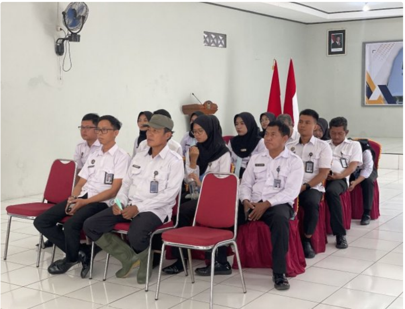
Lapas Pekalongan Ikuti Rakor Pengendalian Capaian Kinerja Semester II dan Refleksi Akhir Tahun 2025

Pekalongan – Lembaga Pemasyarakatan (Lapas) Kelas IIA Pekalongan mengikuti kegiatan Rapat Koordinasi (Rakor) Pengendalian Capaian Kinerja Semester II dan Refleksi Akhir Tahun 2025 yang diselenggarakan secara virtual melalui aplikasi Zoom, pada Senin pagi (15/12/2025).